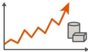
原材料等の価格高騰

部品調達難・物流のひっ迫など外部環境に起因するオペレーション上の課題に着実に対応