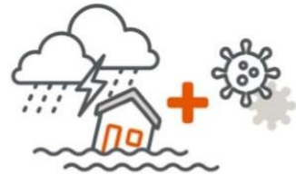
自然災害と感染症の拡大