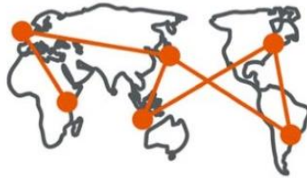
サプライチェーンのひっ迫